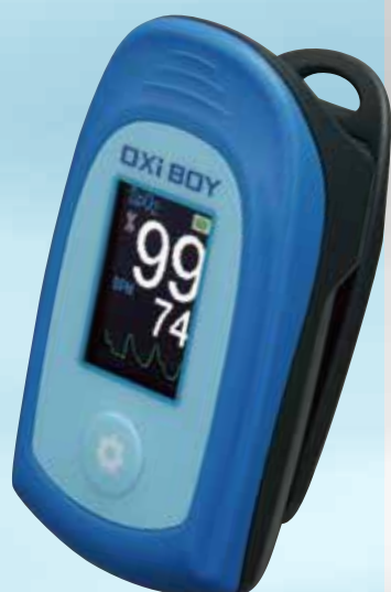
OXi BOY オキシボーイ S-111