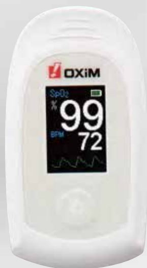
OXi YOUNG オキシヤング S-113