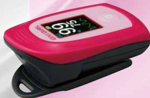
OXi GIRL オキシガール S-112